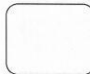
HUELLA DIGITAL ÍNDICE DERECHO