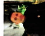
WhatsApp Image 2023-05-03 at 5:45.12 PM.jpeg